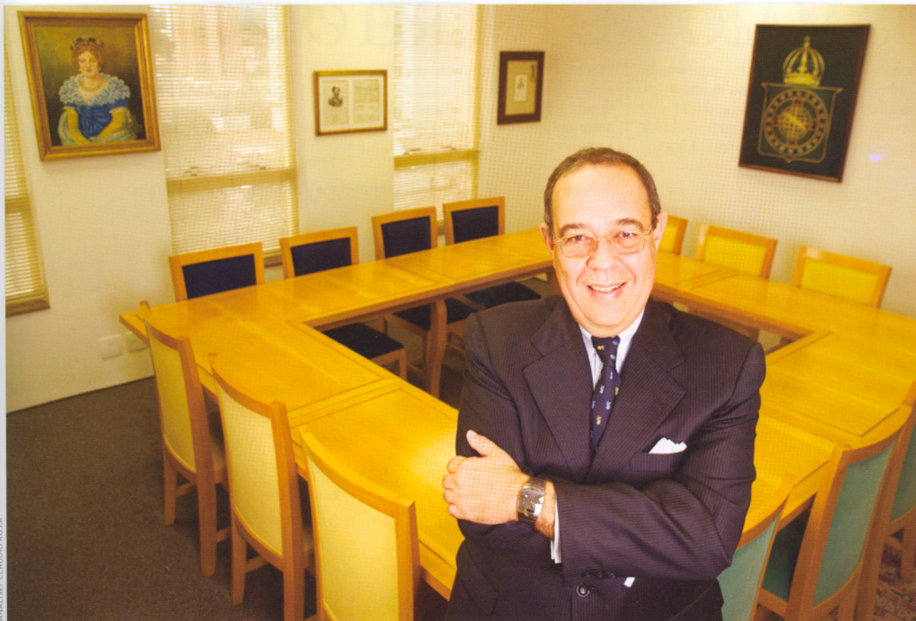
ANÁLISE / CLAUDIO ROSSI

Noronha Advogados, comandado por Durval Noronha, contratou 49 advogados para as áreas de comércio internacional e fusões e aquisições